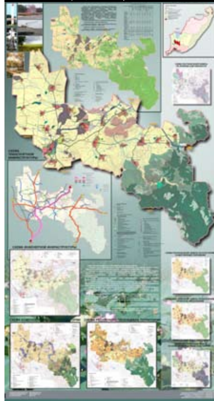
Схема территориального планирования Михайловского муниципального района

Для улучшения эффективности деятельности органов местного самоуправления в области градостроительной деятельности целесообразно возложить реализацию их полномочий на органы архитектуры и градостроительства, входящие в структуру администраций муниципальных образований.