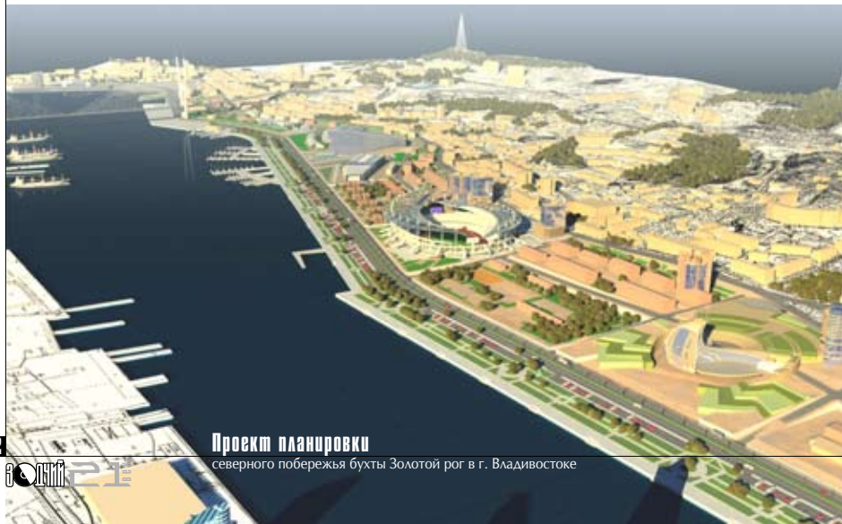
Проект планировки северного побережья бухты Золотой рог в г. Владивостоке

Что касается вузовской подготовки градостроителей, то в настоящее время в Архитектурном институте Дальневосточного государственного технического университета (в настоящее время Дальневосточного Федерального университета) готовят архитекторов общего профиля. Необходимо открыть в архитектурном вузе специальность «градостроительство». Требуется укрепление преподавательского состава профессио-